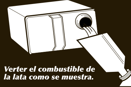
Verter el combustible de la lata como se muestra.

El combustible para estufas y faroles a gasolina Sunnyside es un producto formulado específicamente que quema sin residuos, para usar únicamente en aparatos de campamento a gasolina sin plomo, tales como las estufas y faroles tipo Coleman®. Sunnyside también incorpora inhibidores de BHT para mejorar y estabilizar el combustible a la vez que aumenta la protección contra el óxido y la corrosión.